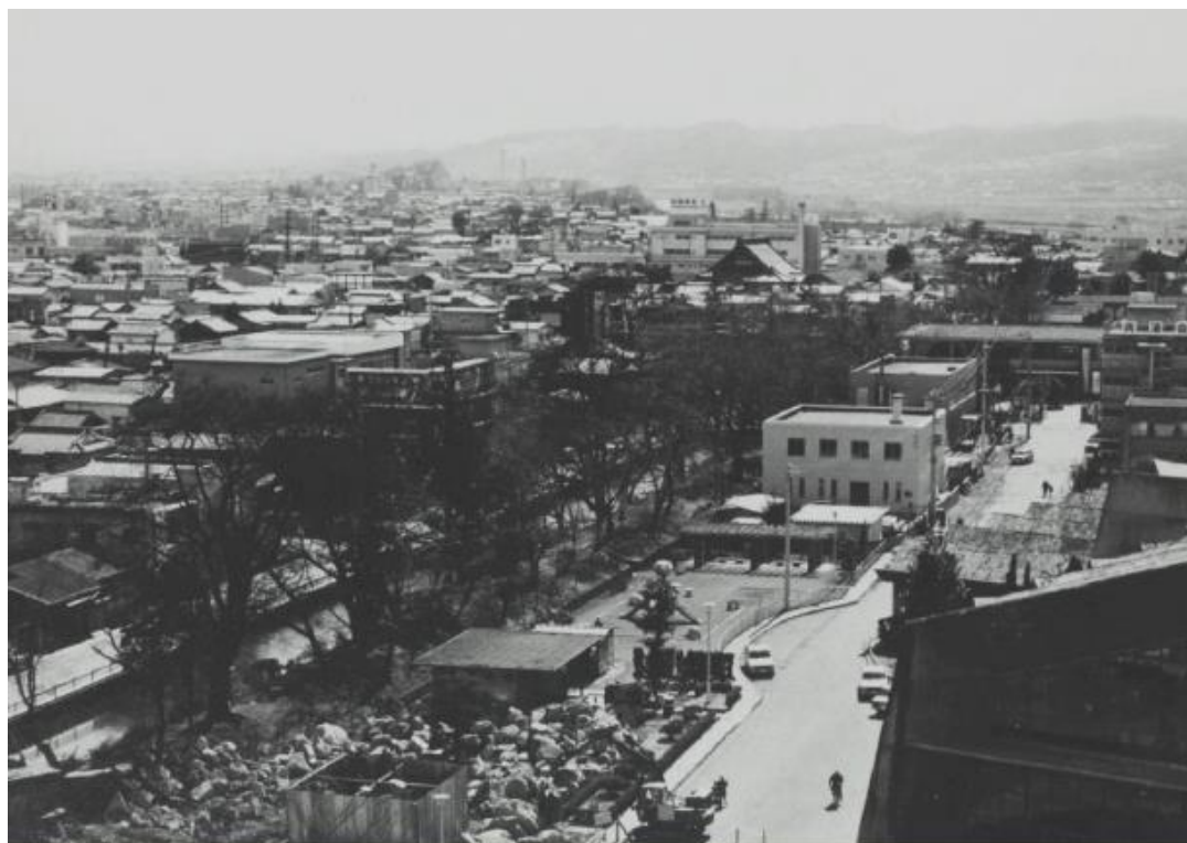
▲昭和 50 年/移築工事中の乾櫓(伊藤富太郎氏撮影写真、中央図書館HP)

されたもので、 しょうわ 昭和26(1951) ねん 年に しもことりまち 下小鳥町で な や ものおき ご や 納屋(物置小屋)として使われているのが はっけん 発見され、 しょうわ 昭和51(1976) ねん 年に げんざいち 現在地へ いちく 移築されたのです。 たかさきじょう 高崎城の ほんまる 本丸(城の中心となる部分)には さんかいやぐら 三階櫓のほかに よすみ やぐら た 四隅に櫓が建てられていて、 いぬいやぐら 乾櫓はこの いぬい ほくせい うち戌亥(北西)の方角にあったものです。 げんざい 現在の ぼしょ 場所へ いちく 移築するにあたり じぼん 地盤の ほきょう 補強のために いしがき 石垣が つく 造られましたが、もともとは ほんまる 本丸の どるい 土塁の うえ 上に た 建っていました。