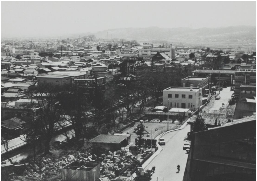
▲昭和50年/移築工事中の乾櫓

されたもので、 しょうわ 昭和26(1951) ねん 年に しもことりまち 下小鳥町で なや 納屋(物置小屋) ものおきごや として使われているのが つか 発見され、 はっけん 昭和51(1976) しょうわ 年に ねん 現在地 げんざいち へ いちく 移築されたのです。 たかさきじょう 高崎城の ほんまる 本丸(城の中心となる部分)に しろ は ちゅうしん 三階櫓のほかに ぶぶん 四隅に いぬいやぐら 櫓が建てられていて、 いぬいやぐら 乾櫓はこの うち いぬい 戌亥(北西) ほくせい の方角にあつたものです。 ほうがく 現在の げんざい 場所へ ぼしょ 移築 するにあたり じぼん 地盤の ほきょう 補強のために いしがき 石垣が つく 造られました。も ともとは ほんまる 本丸の どるい 土塁 うえ の上に た 建っていました。