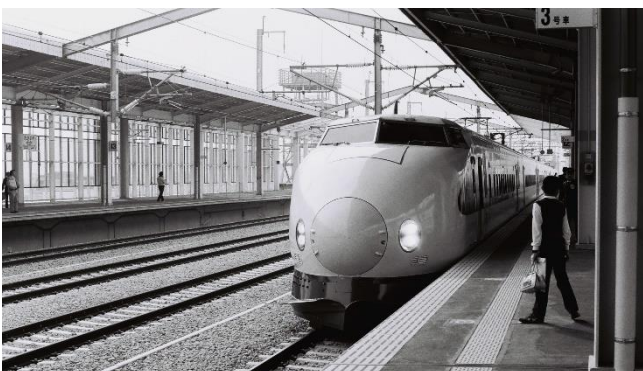
上越新幹線開業日 1982(昭和57)年11月15日撮影

今号の特集が「駅！電車！！新幹線!!!」なので、番外編として、高崎のことだけでなく新幹線や列車についての思い出を綴ってみたいと思います。