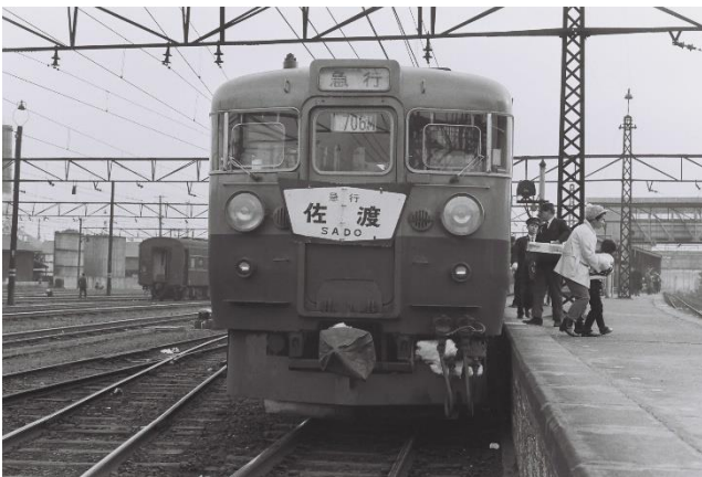
急行佐渡 1967(昭和42)年1月6日撮影