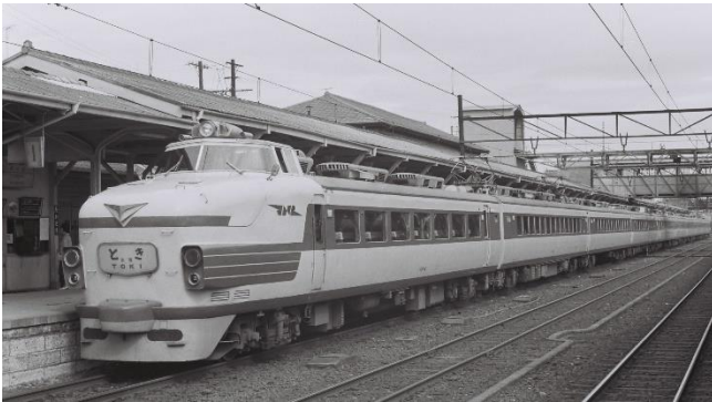
急行とき 1965(昭和40)年9月30日撮影