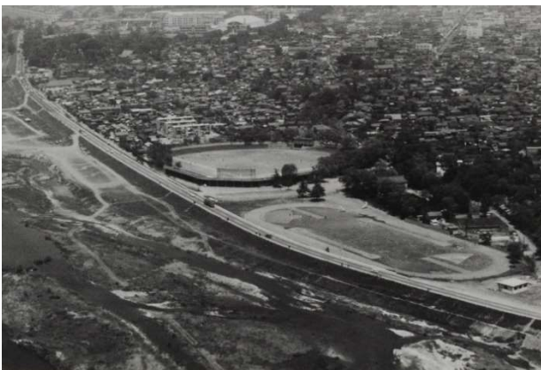
昭和38年頃の城南野球場・陸上競技場全景

また、城南球場は群馬の高校球児をずっと見守ってきました。私もここで、幾多の好ゲーム、球児の涙を見てきました。遠い昔の特大ホームランに思いを馳せながら、球場に足を運びたいと思います。