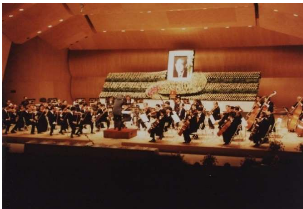
丸山勝廣氏楽団葬;小澤征爾氏指揮