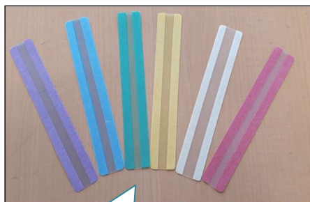
紫、青、緑、黄、クリア、ピンク 全6色を各クラスに配布

また、2学期から学校図書館のカウンターにも手作りのリーディングトラッカーを多数配置して、児童が自由に利用できるようにしました。それまでは市販のリーディングトラッカーしかなかったため、利用するときは貸出ノートに名前を書いてもらっていたのですが、これが児童には少々煩わしかったようです。自由に使えるようになって「気軽に使えるのがいい。」との児童の声も聞こえています。